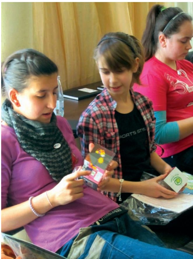
Участници в обучението разглеждат информационни материали и игри, отпечатани от Фондация Приложни изследвания и комуникации като част от проекта

Екипът ни осигури на младите изследователи пълна свобода при избора на цел и метод на техните изследвания през втората половина на втория ден на обучението. Изборите бяха трудни и плод на задълбочени дискусии с претегляне на всички плюсове и минуси в полза на различните методи за изследване и внимателно избиране на точните думи при формулирането на целите на изследванията. Участниците от по-малката възрастова група избраха да направят структурирани интервюта със своите съученици, а по-големите деца се спряха на анонимните анкети като метод за събиране на информация.