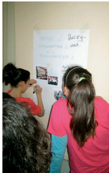
Оживена дискусия за предимствата и недостатъците на един или друг метод за събиране на информация