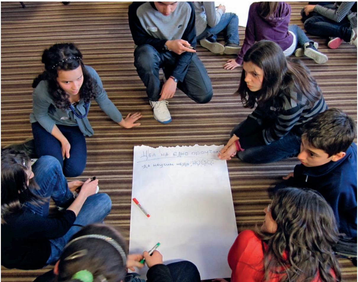
Младите изследователи определят целта на изследването